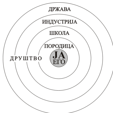
График 1: Основна шема егоцентричног погледа на друштво (преузето из: Elias 1978: 14)

2016: 42), што је прегнантно сажето управо у наслову његове књиге из 1987. године: Die Gesellschaft der Individuen (енглески превод: Elias 1991).